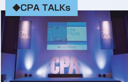
◆ CPA TALKs